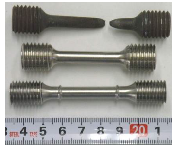
引張クリープ試験片