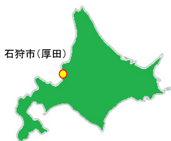
図1 北海道暴露場の位置

JFEテクノリサーチ北海道暴露試験場は石狩市(厚田)にあり、西海岸より約250mに位置し、冬期には強い西風によって海塩の影響を強く受けます。目の前を通る国道には冬期に凍結防止剤や融雪剤が散布されます。