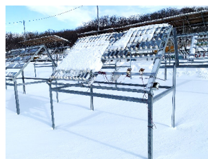
図5 雨掛大気暴露架台