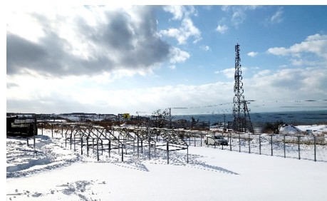
図3 暴露場から石狩湾方向を臨む