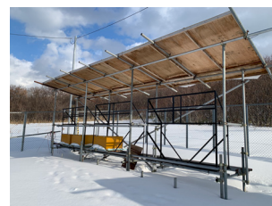
図6 軒下大気暴露架台