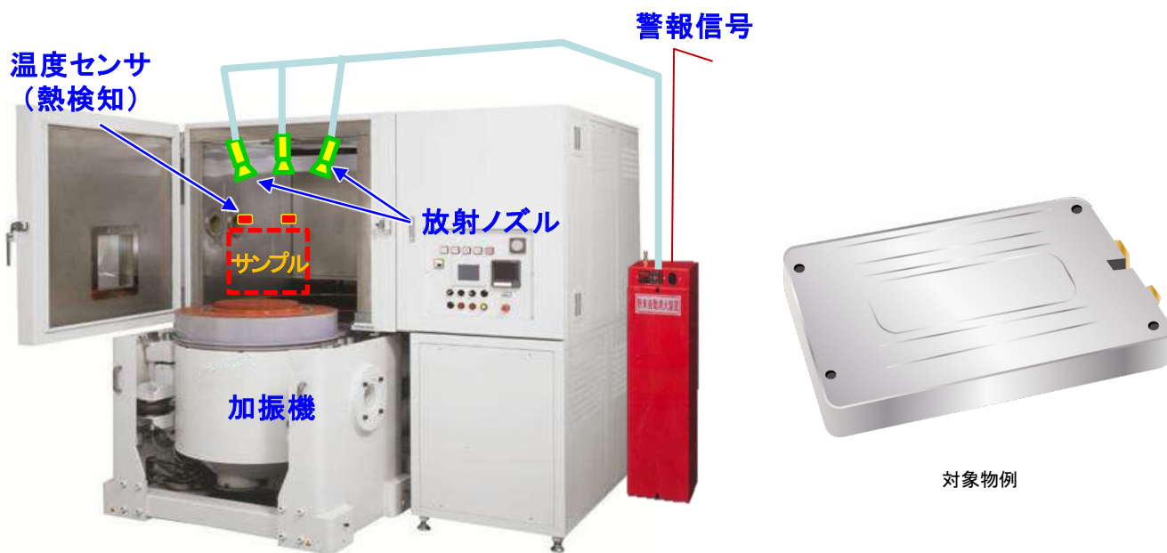
自動消火設備付振動試験機 イメージ図